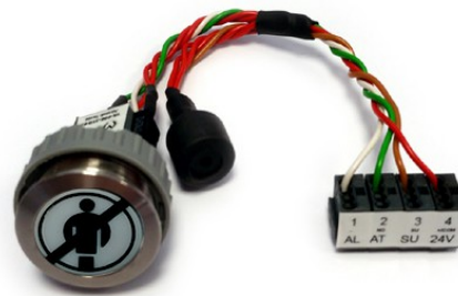
Abstell-Taster TA-099-310-62 (VAT)