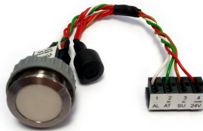
Abstell-Taster TA-099-310-62 (VAT)