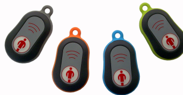
Gehäuse dunkelgrau, Halter in 4 Farben IP65