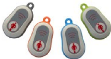
Gehäuse hellgrau, Halter in 4 Farben