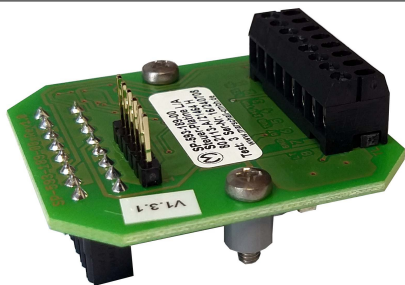
Steuerplatine SP-593-189-00 (mit Steck-Klemme SK-035-SCR-08)