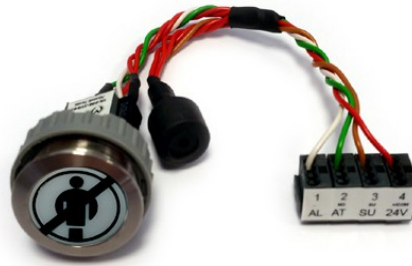
Abstell-Taster TA-099-310-62 (VAT)